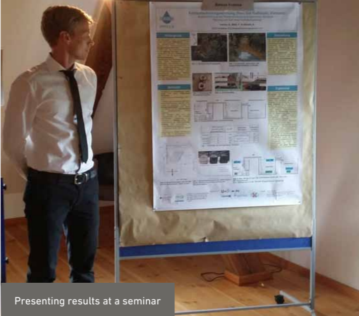
Presenting results at a seminar

No work permit is needed for the fellowship stay in Germany. For the right of entry into Germany, however, some states require a visa. Fellowship recipients must apply for visa themselves in their native countries.