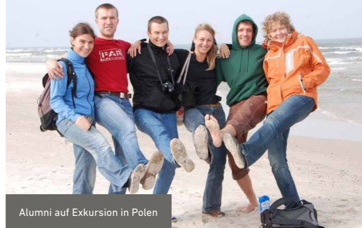
Alumni auf Exkursion in Polen

Während des Stipendiums werden Lösungsvorschläge zu aktuellen Umweltthemen erarbeitet, sodass die Alumni anschließend einen Wissenstransfer in die Herkunftsländer leisten können. Durch die internationale Zusammenarbeit werden Barrieren abgebaut und Kontakte aufgebaut, sodass langfristig ein starkes Netzwerk engagierter Umweltexpertinnen und -experten entsteht.