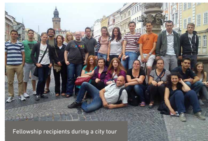
Fellowship recipients during a city tour