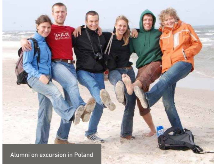
Alumni on excursion in Poland

During the fellowship practical solutions for current environmental issues are developed. After their stay in Germany the alumni are well qualified to tackle these issues in their home countries thus assuring efficient knowledge transfer. Working closely together in an international context helps to breakdown existing barriers. The acquired contacts will create a strong network of highly committed environmental experts.