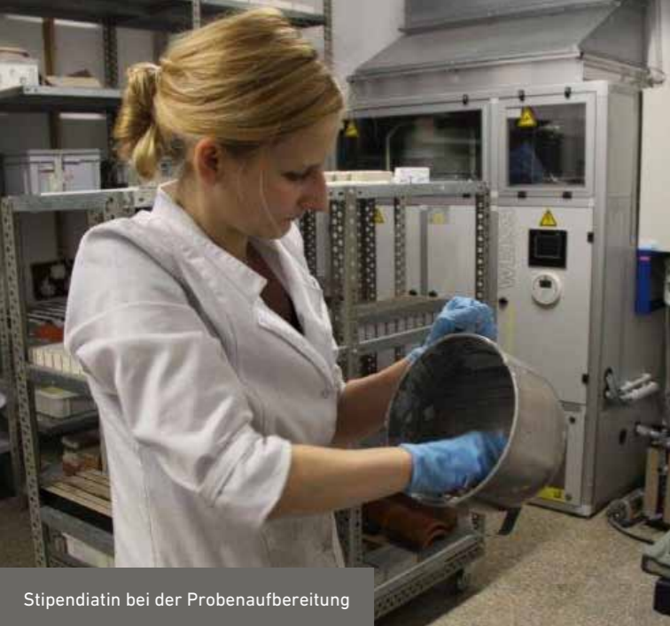
Stipendiatin bei der Probenaufbereitung