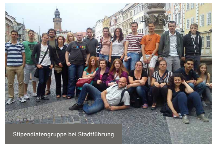
Stipendiatengruppe bei Stadtführung