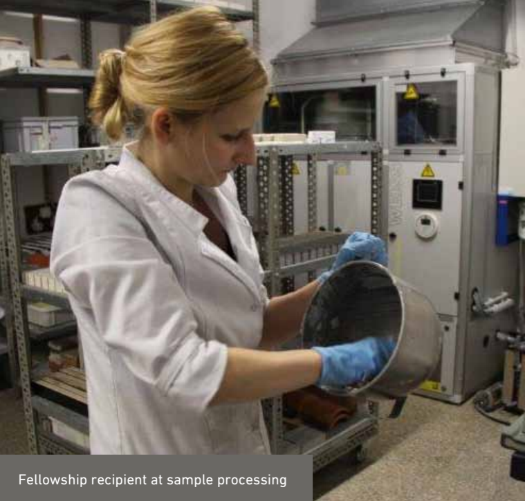
Fellowship recipient at sample processing