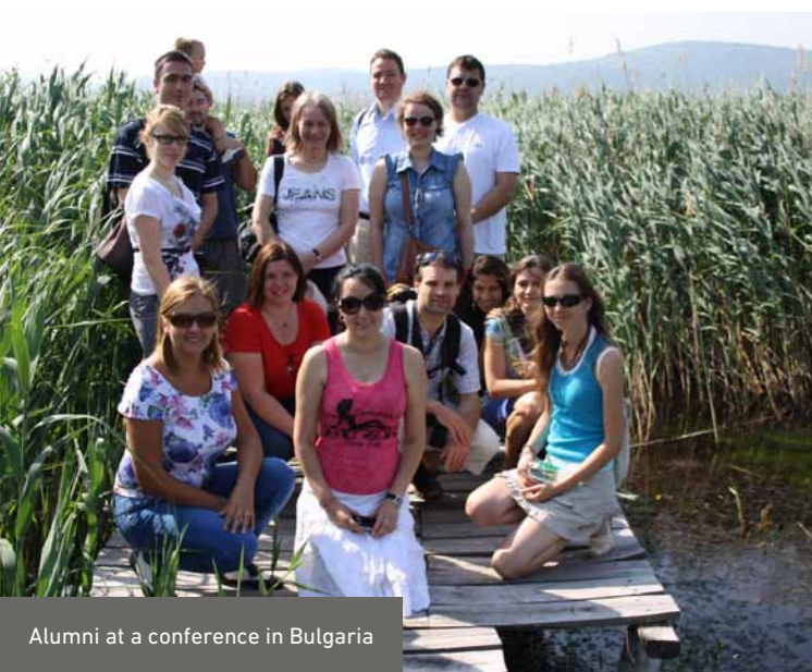
Alumni at a conference in Bulgaria

DBU coaches its fellows during the whole stay. During seminars the fellowship recipients can present their topics and their results and network with each other. Furthermore, DBU welcomes and supports individual initiatives to organize further professional events and seminars.