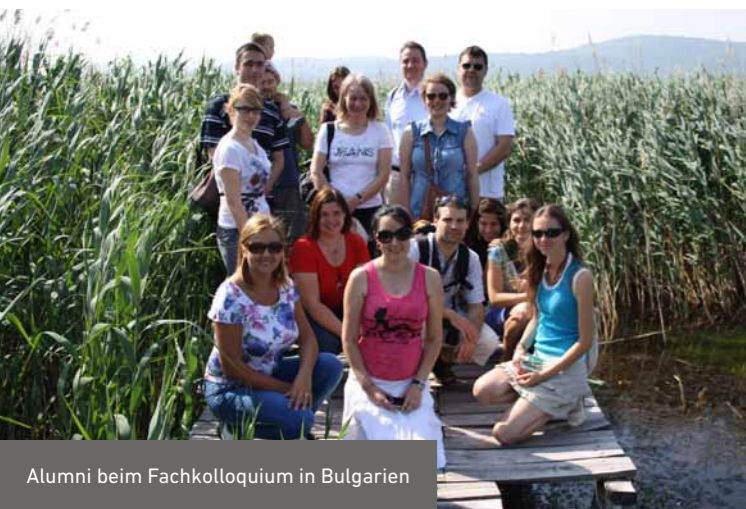
Alumni beim Fachkolloquium in Bulgarien